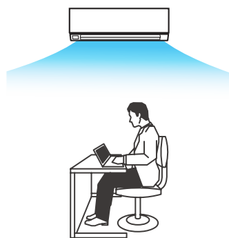
Ideální výstup proudu vzduchu v režimu chlazení